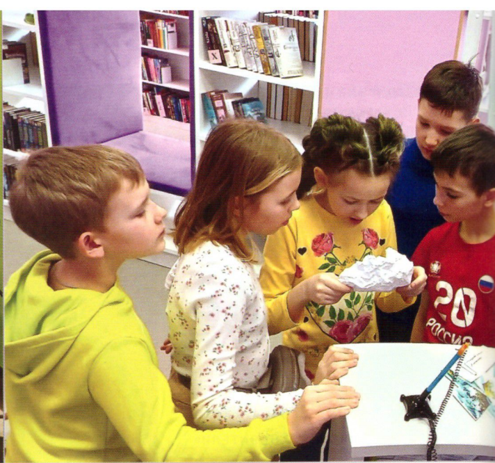
УЧАСТНИКИ КВЕСТА «ПО СТРАНИЦАМ ЛЮБИМЫХ КНИГ»

В рамках нового проекта библиотечно-волонтерского движения «3D: Делай добро другим» стали проходить встречи с волонтерами североморского приюта для бездомных животных «Надежда», оказывается помощь в сборе макулатуры, проводятся благотворительные фотосессии «Мой любимый питомец», а полученные средства передаются на нужды приюта. Библиотекари вместе с волонтерами стали участниками экологической акции «Батарейки, сдавайтесь!», проводимой под руководством общественной приемной политической партии «Единая Россия». В течение месяца было собрано более 100 кг отслуживших свой срок батареек!