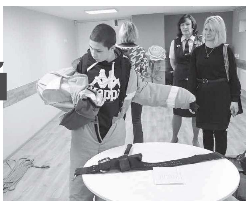
Одно из самых технически сложных и одновременно самых интересных заданий — облачение в боевой костюм пожарного, на него давалась пробная попытка.

— Самое увлекательное — надевать костюм пожарного. А самое трудное,